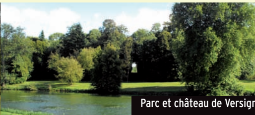
Parc et château de Versigny