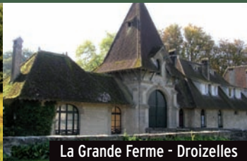
La Grande Ferme - Droizelles

Sa reconstruction dans le style classique a débuté en 1640. La création du jardin sera confiée au paysagiste Le Nôtre.