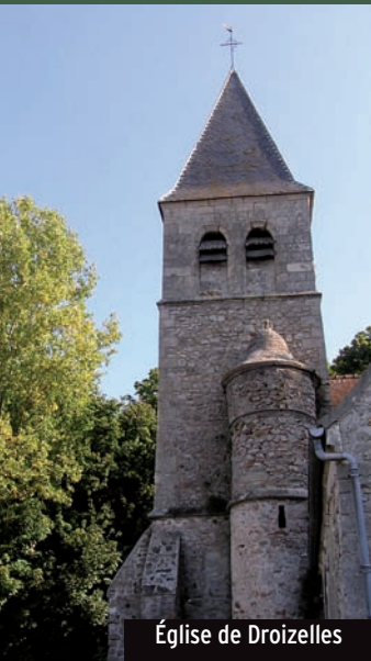
Église de Droizelles