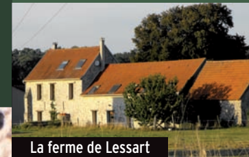
La ferme de Lessart