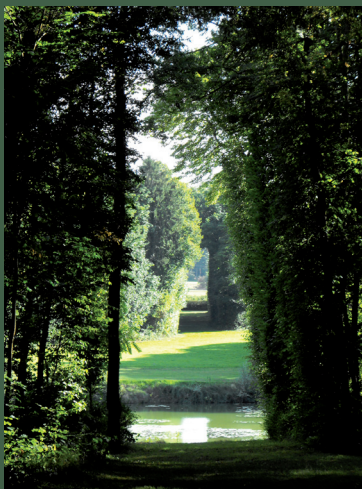
Parc du château de Versigny

De nombreux bois, de surfaces plus ou moins importantes, subsistent à l'écart des grands plateaux agricoles. Ils sont liés soit au relief plus accidenté, soit à la nature plus humide du sol.