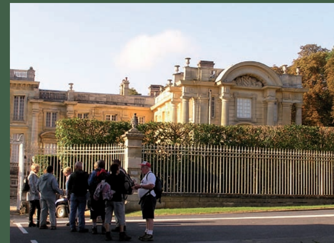
Château de Versigny

L'ancienne place forte de Versigny, édifiée aux XIV e et XV e siècles, fut brûlée sur ordre du Cardinal de Richelieu, inquiet de la puissance de ses propriétaires.